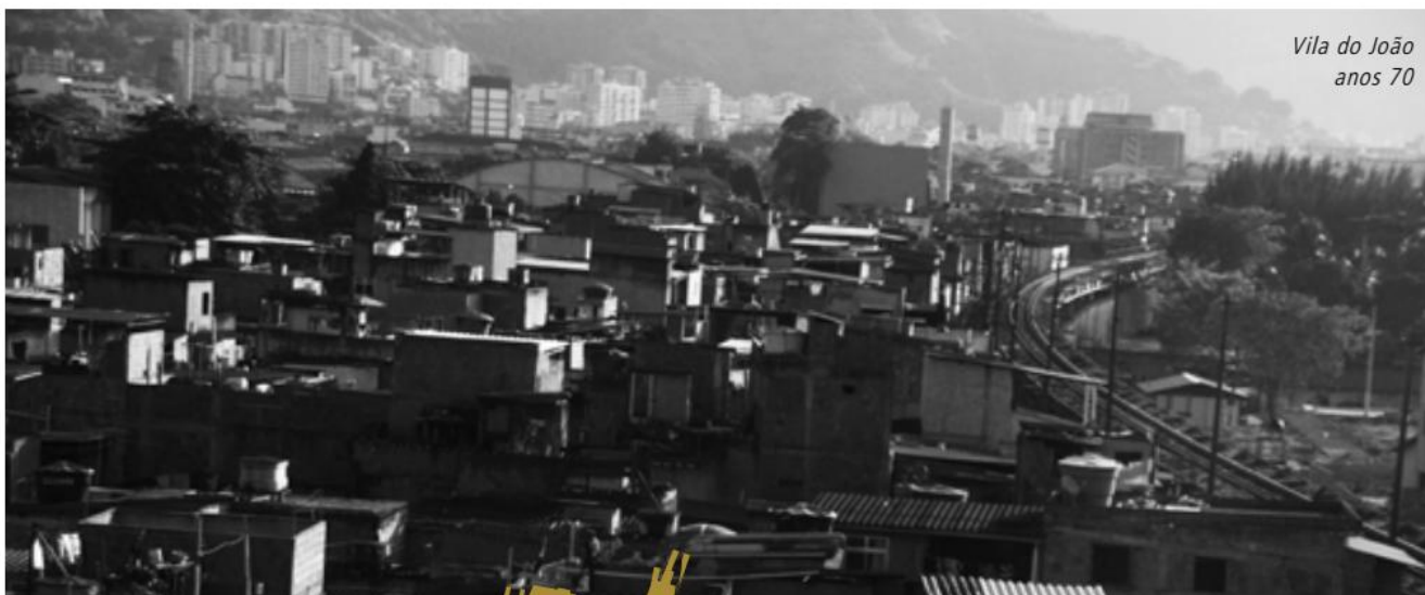
Vila do João anos 70

3 Segundo o Instituto Gênesis, da Pontifícia Universidade Católica do Rio de Janeiro (PUC-Rio), "as incubadoras sociais têm como objetivo o fortalecimento local de comunidades de baixo desenvolvimento sócio-econômico através da formação de empreendedores com uso de tecnologia social. Os empreendimentos gerados pela comunidade devem integrar uma determinada cadeia produtiva, que dará origem a uma marca de excelência na região. Desta forma, será criado um ambiente empreendedor que beneficiará a comunidade em diversos aspectos, principalmente qualidade de vida, cidadania e visão de mundo".