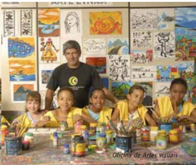
Oficina de Artes visuais