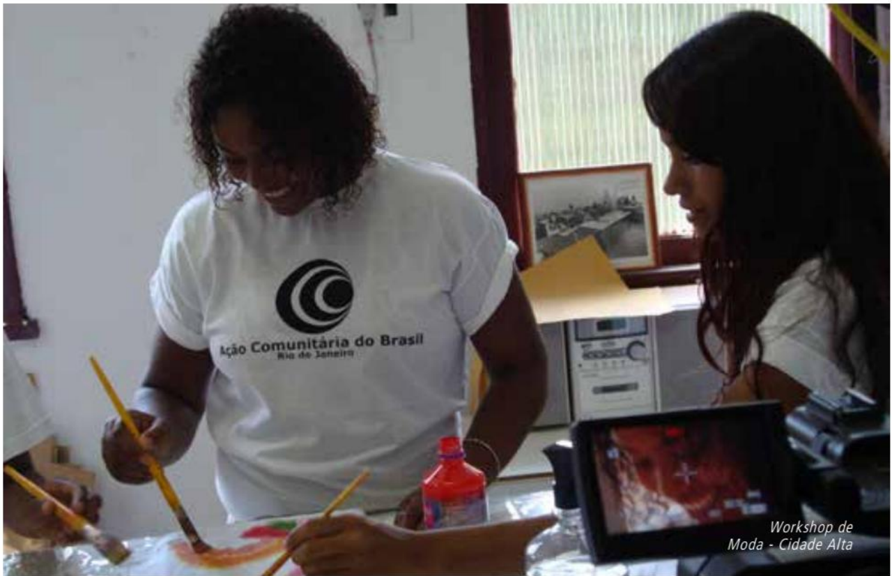
Workshop de Moda - Cidade Alta