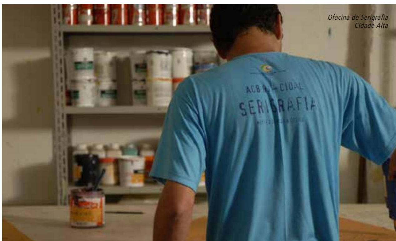
Oficina de Serigrafia Cidade Alta