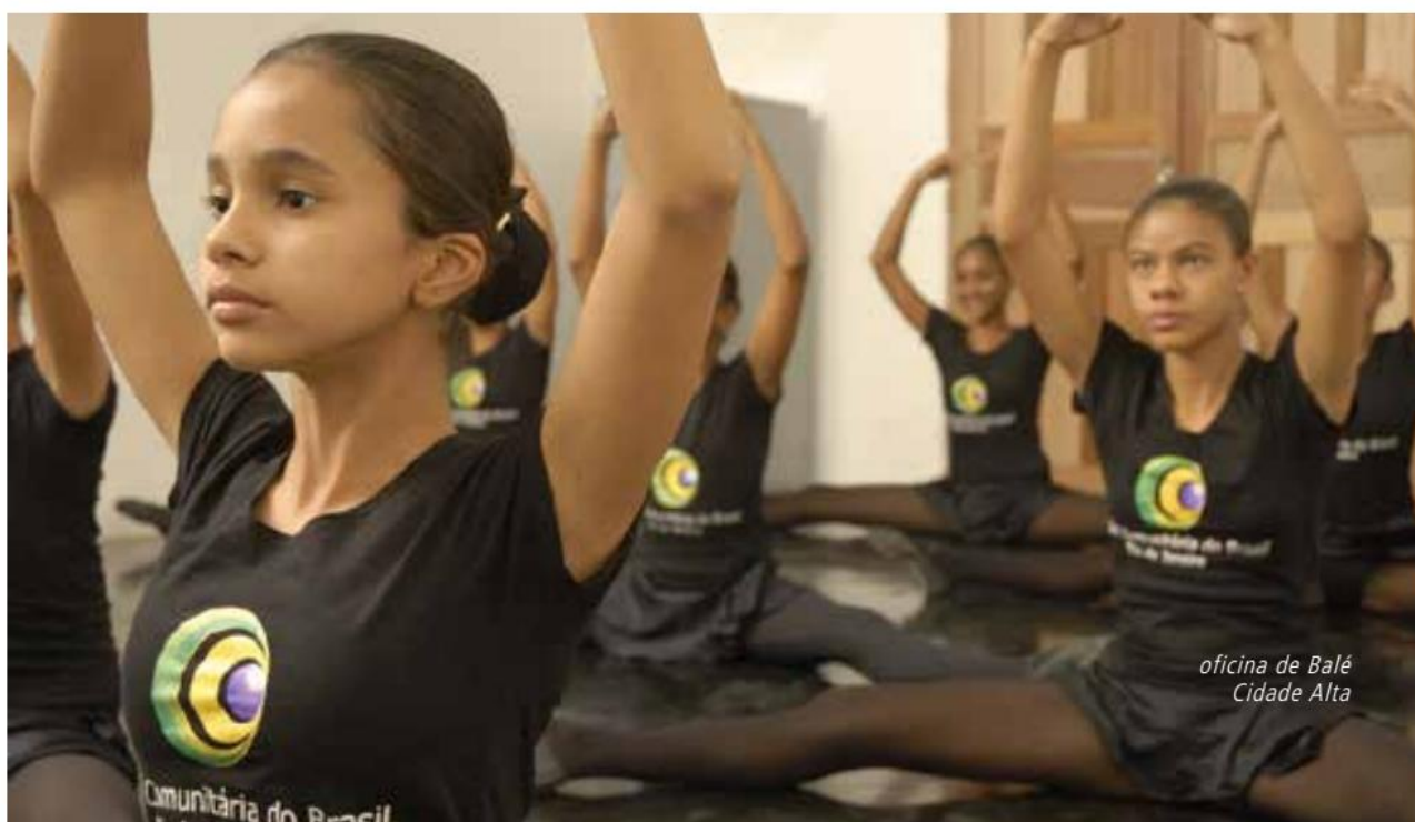
oficina de Balé Cidade Alta