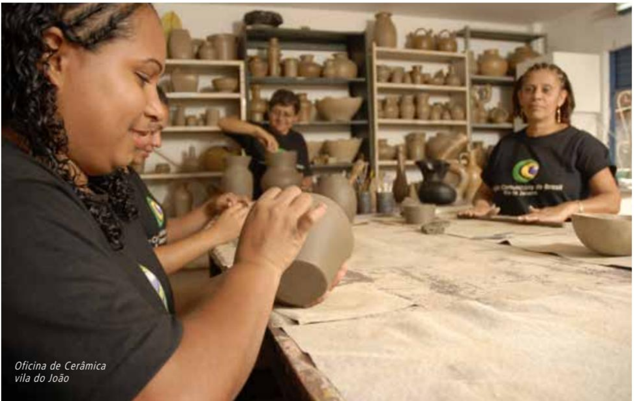
Oficina de Cerâmica vila do João