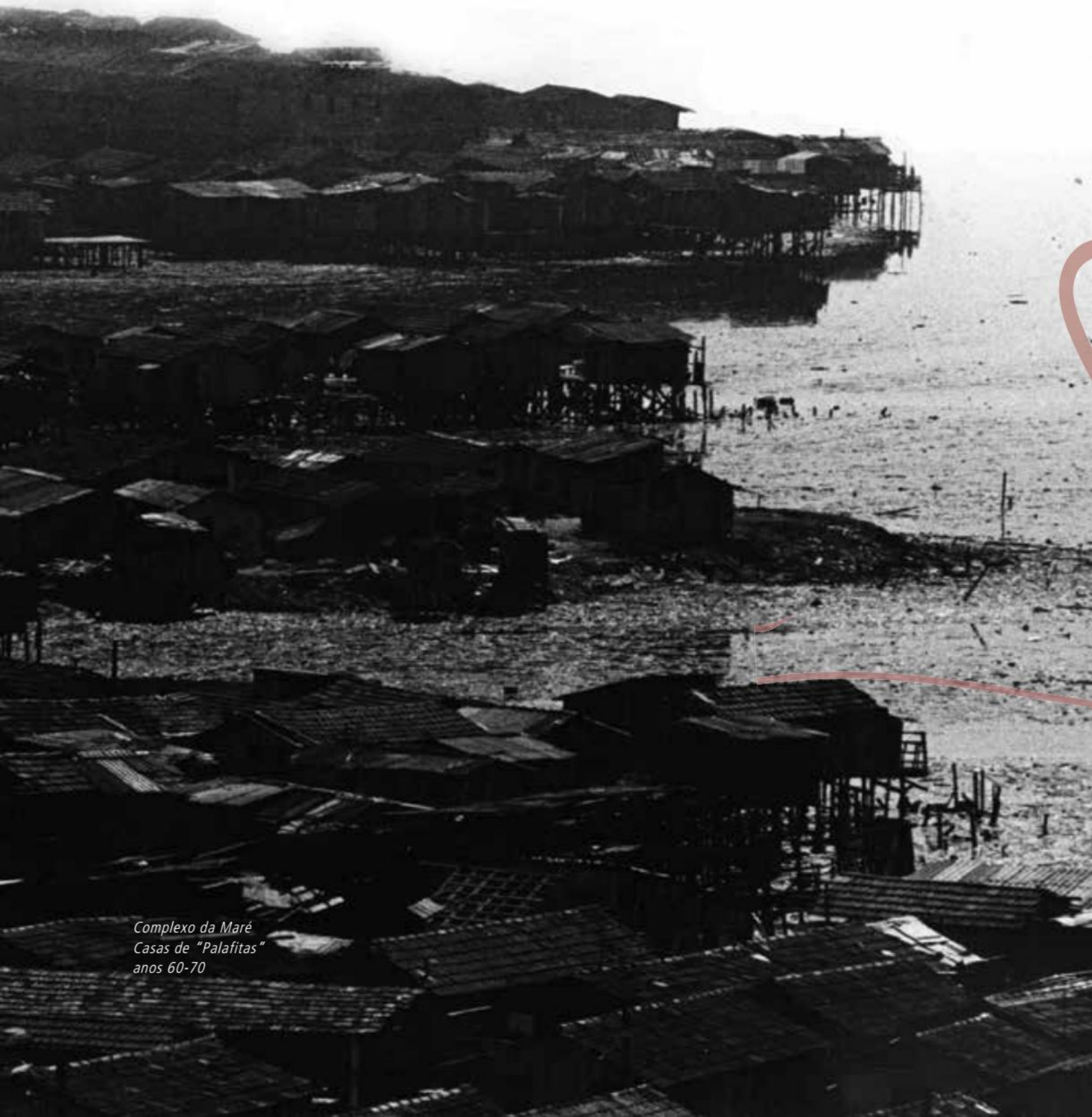
Complexo da Maré Casas de "Palafitas" anos 60-70