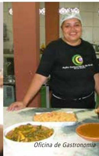
Oficina de Gastronomia