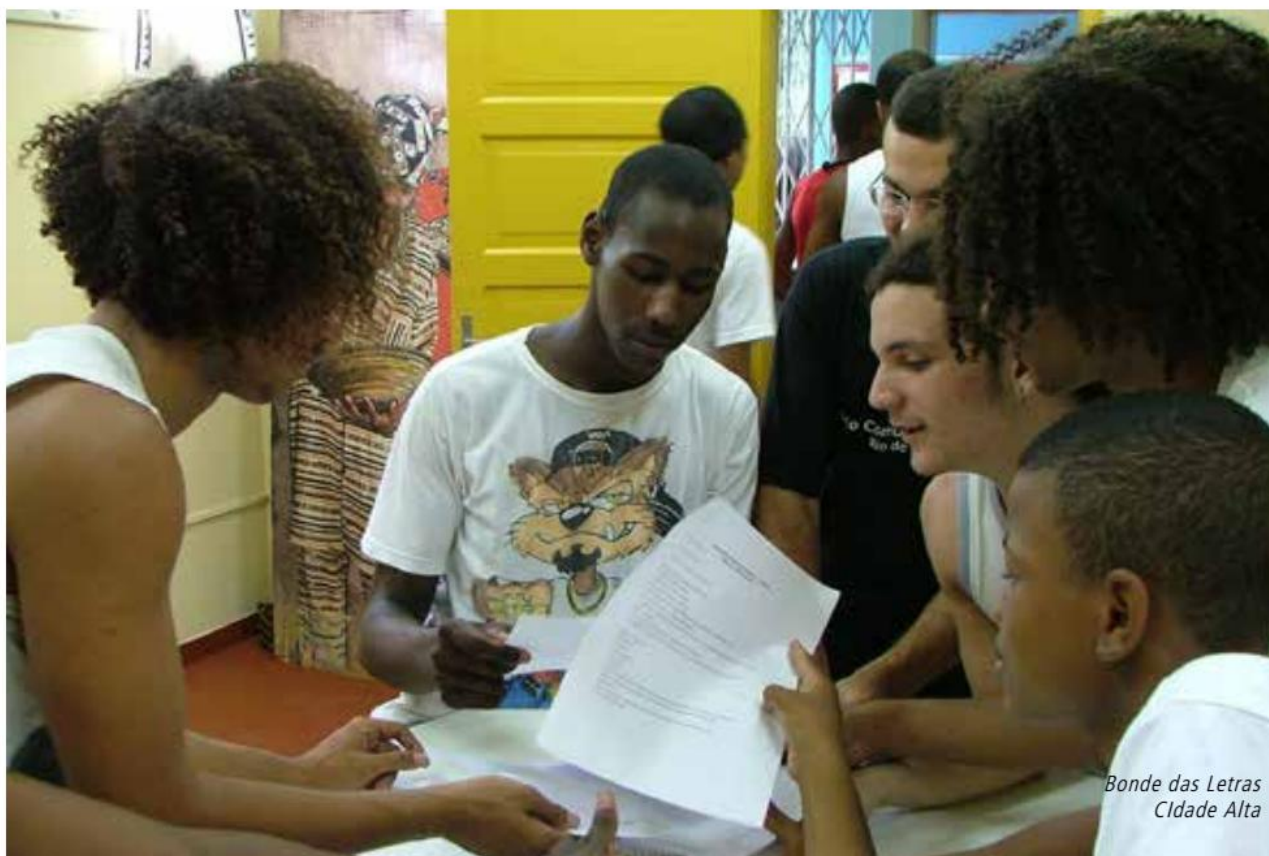
Bonde das Letras Cidade Alta

o grupo perdesse um de seus principais elementos de diferenciação: a ênfase na culinária étnica. No entanto, por compreender que este elemento, além de um diferencial no mercado, é uma estratégia de valorização cultural das influências africanas existentes na comunidade, o grupo tenta retomar, sempre que possível, sua especificidade. Ainda no caso do Buffett, a grande procura e a necessidade de um melhor planejamento das atividades fazem com que seja fundamental que se tenha uma pessoa responsável por gerenciar o empreendimento – fiscalizando as compras, fazendo os contatos, centralizando os pedidos etc. Todavia, tal exigência representa mais custos para o grupo, diminuindo a rentabilidade do empreendimento. Ainda que a participação nos grupos produtivos tenha gerado renda para essa população, os limites da produção e da comercialização ainda se apresentam como possíveis obstáculos para a sustentabilidade das oficinas e das famílias envolvidas no projeto. Torna-se um desafio, dessa forma, planejar uma estratégia em que originalidade, criatividade e autonomia não sejam perdidas, mas também não sejam impedimentos à produção e à reaplicação das iniciativas”.