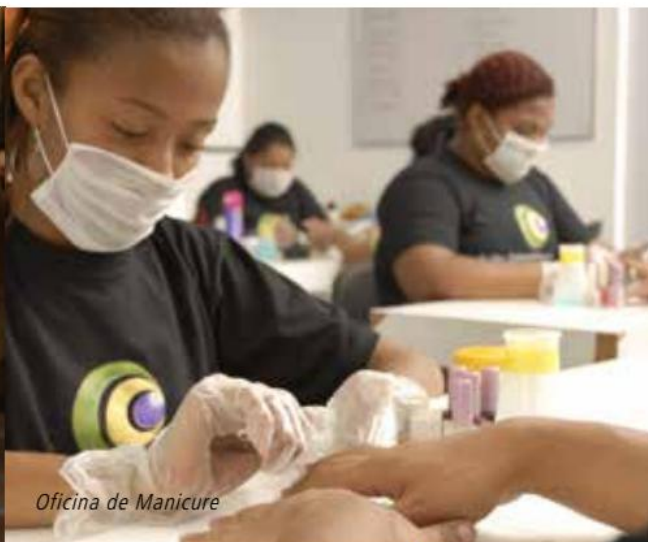
Oficina de Manicure