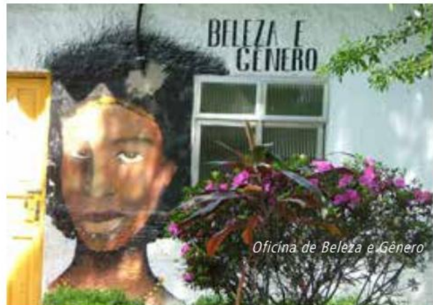
29 O processo histórico corrente acabou levando ao debate sobre uma nova geração de direitos, a exemplo dos direitos ambientais.