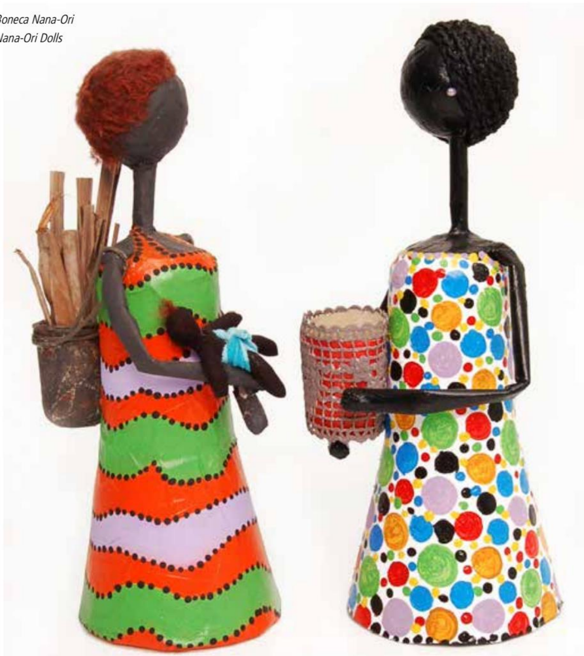
Boneca Nana-Ori Nana-Ori Dolls

Recently the NGO performed the Pilot-Project Creative Start-Up Businesses for Kenya's Youth in Kisumu, Kenya, in association with the NGO Lake Victoria Nyanza and Creative Arts Association (LAVINCA) and the SU-SSC/PNUD/NY. As a result, a catalogue on craft and artistic products originated from creative economy was produced, putting together the work of 25 craftsmen/women.