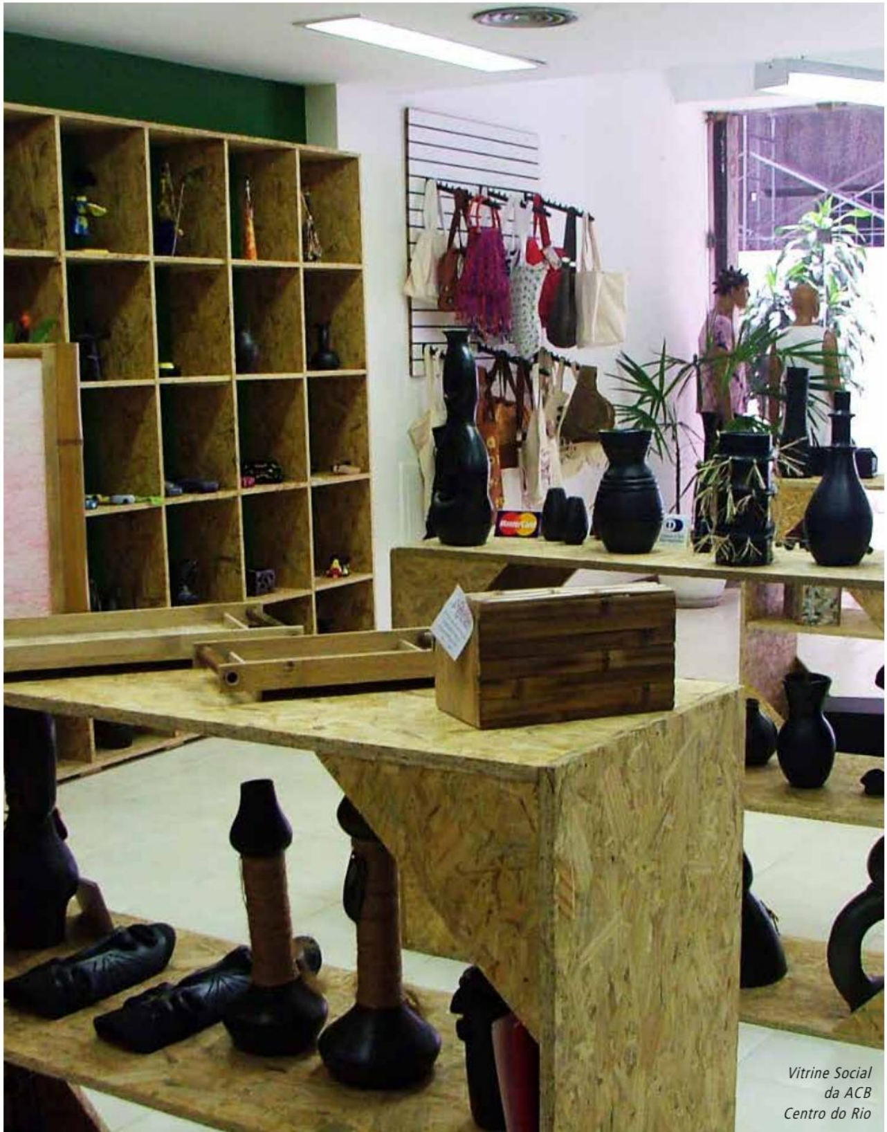
Vitrine Social da ACB Centro do Rio