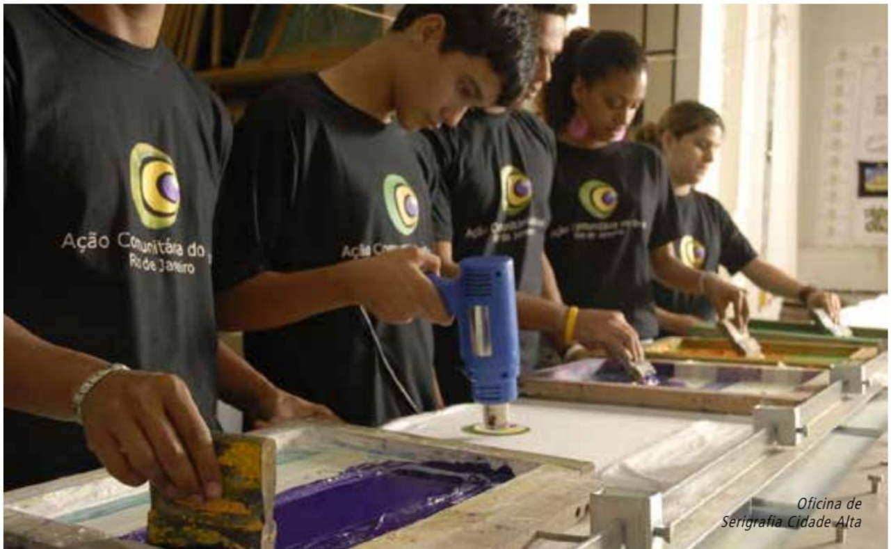
Oficina de Serigrafia Cidade Alta