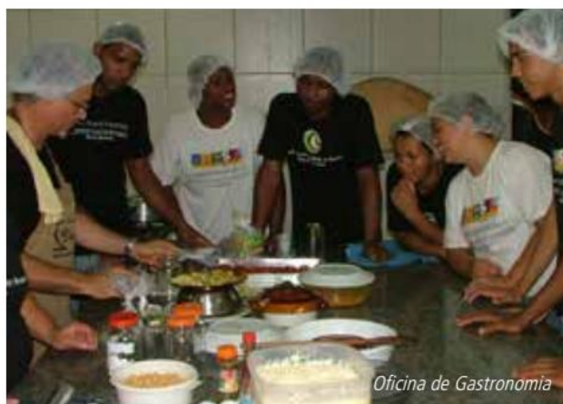
26 Os dados sobre o projeto Escola-Oficina-Cidadã que seguem foram todos retirados dos relatórios de avaliação de desenvolvimento Marcos de Desenvolvimento de Base/MDB, elaborados pela própria ACB/RJ em monitoramento pela IAF.

Decorrente desse processo, em 2006, a oficina de Cerâmica Negra da Maré recebeu o Prêmio Top 100 do artesanato brasileiro do SEBRAE, sendo a única organização produtiva do Estado do Rio de Janeiro contemplada e, foi convidada ainda a expor sua produção no Casa Cor – evento anual largamente reconhecido na área de arquitetura e decoração.