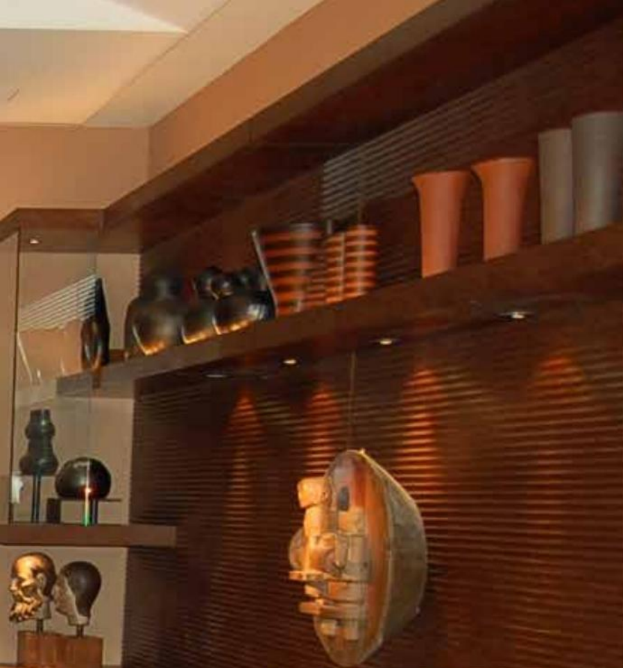
Casa Cor 2007 Premio Top 100 Cerâmica Negra da Maré