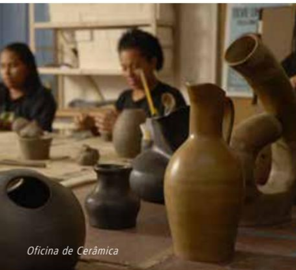
Oficina de Cerâmica

Com esse propósito foram estruturados, dentre outros, os cursos e oficinas de Moda, Beleza e Gênero, nos quais a