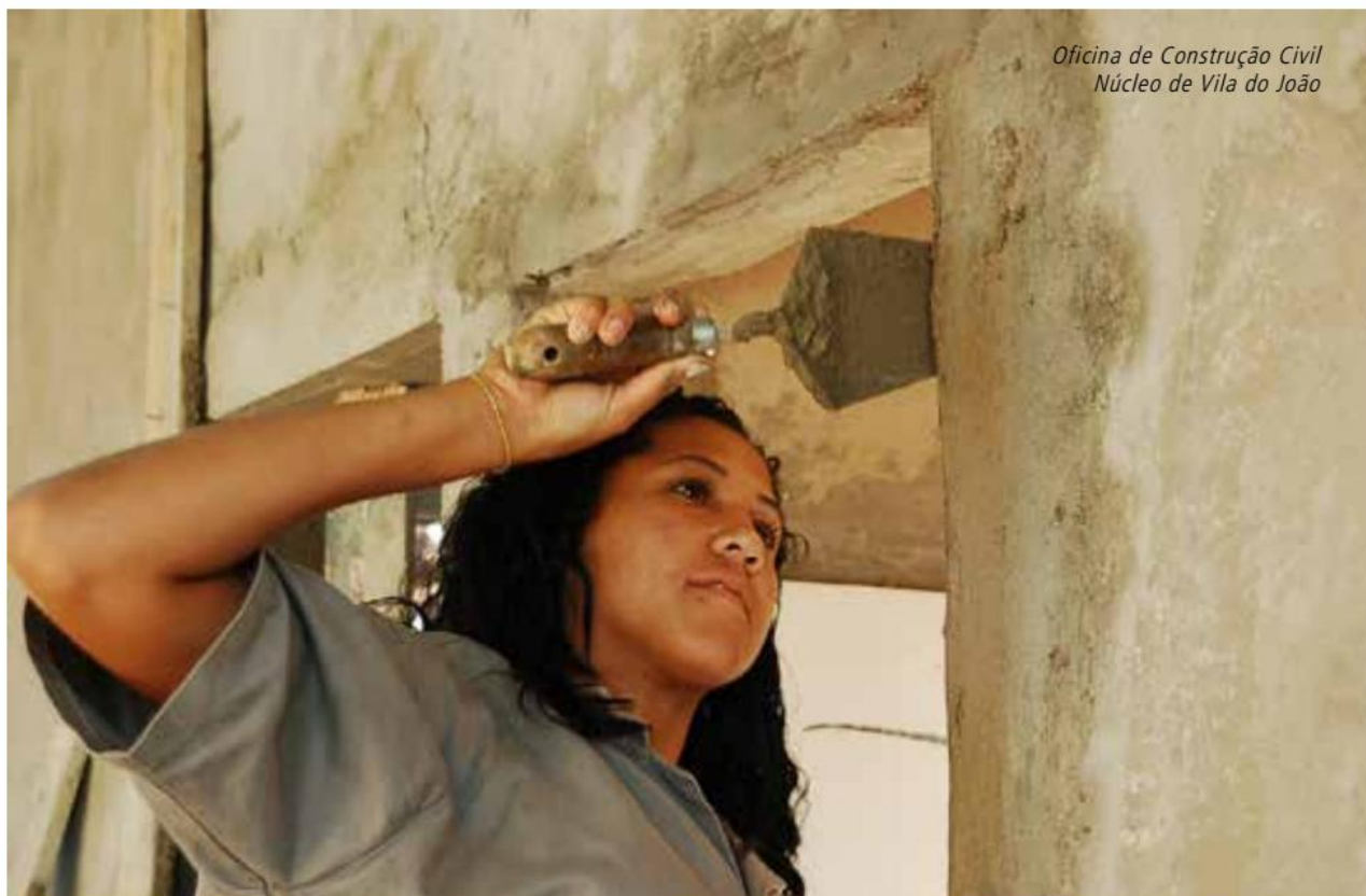
Oficina de Construção Civil Núcleo de Vila do João