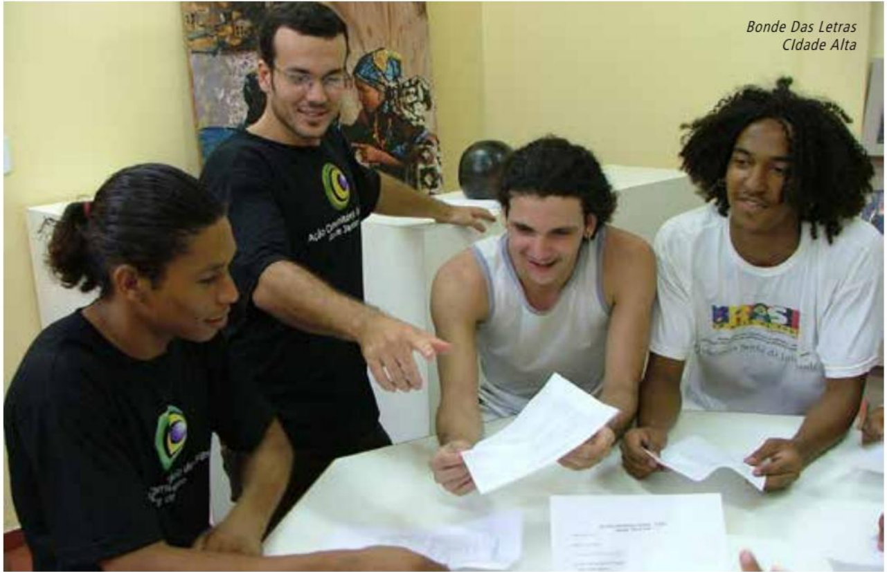
Bonde Das Letras Cidade Alta