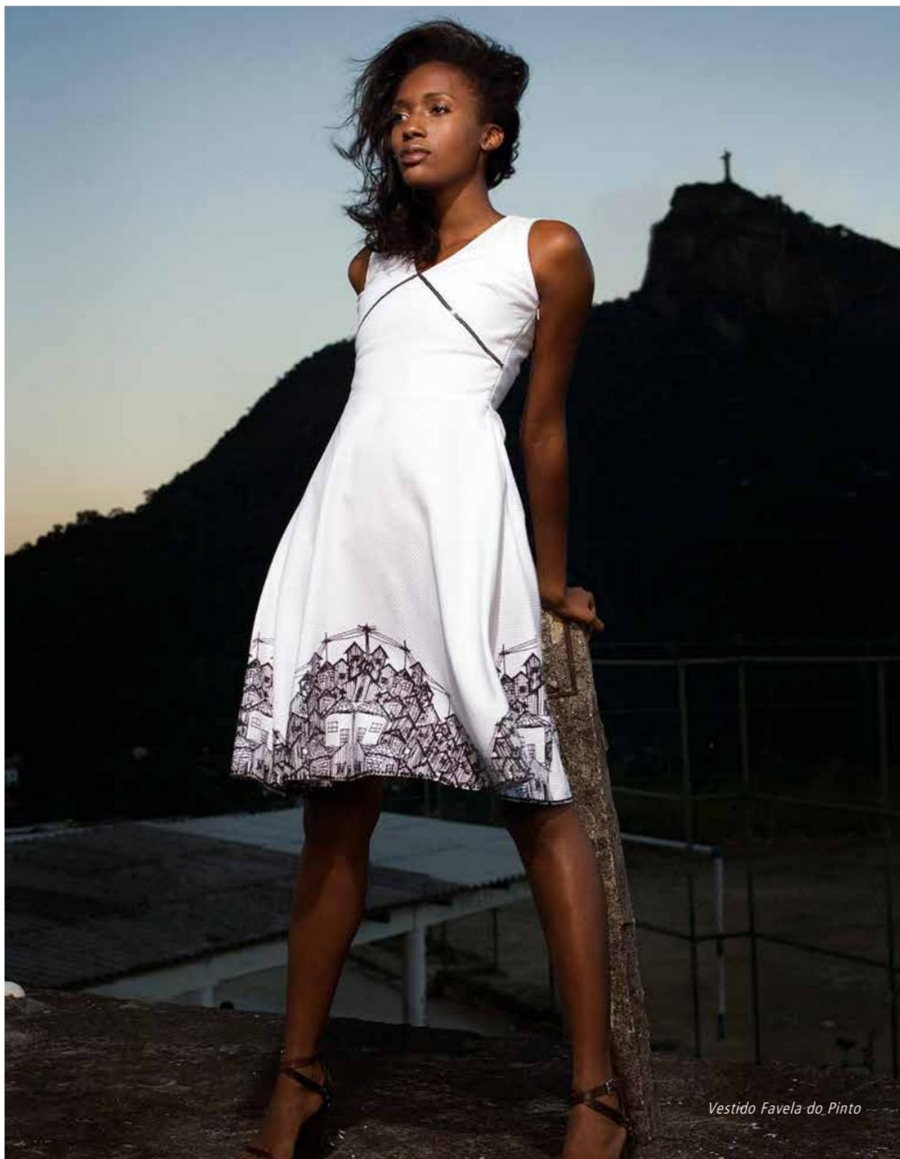
Vestido Favela do Pinto