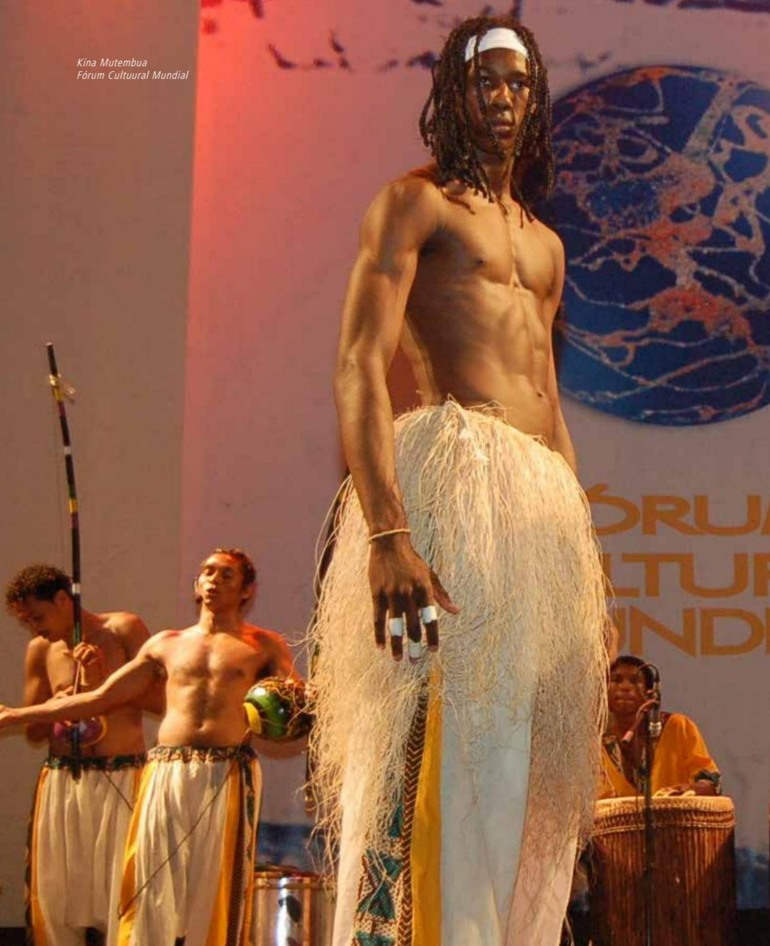
Kina Mutembua Fórum Cultural Mundial