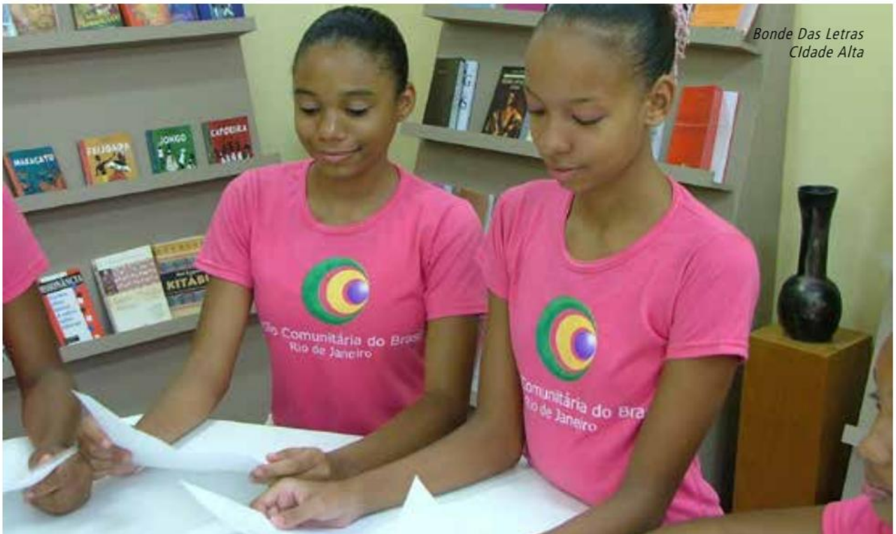
Bonde Das Letras Cidade Alta