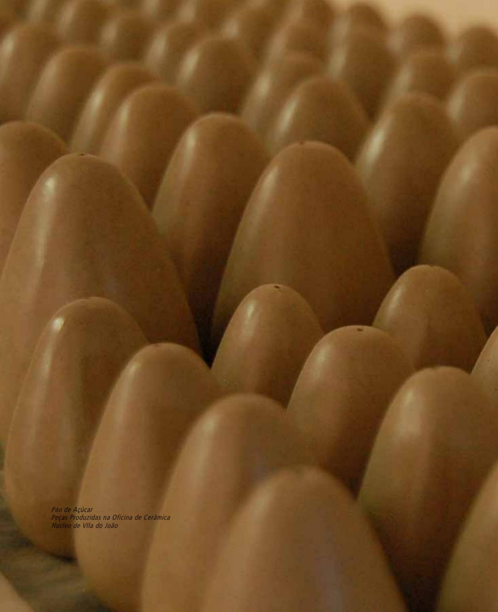
Pão de Açúcar Peças Produzidas na Oficina de Cerâmica Núcleo de Vila do João