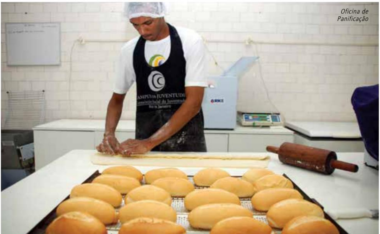
Oficina de Panificação