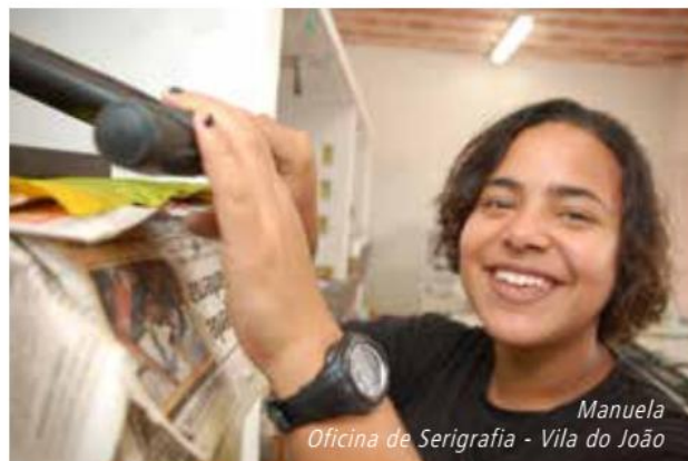
Manuela Oficina de Serigrafia - Vila do João

4 De fato, desde sua fundação a ACB/RJ tinha capacitado milhares de pessoas. Nesse momento, contudo, tratava-se de repensar esta formação. Em vez de se pensar em iniciação profissional, visava-se à qualificação profissional e à realização do trabalho coletivo.