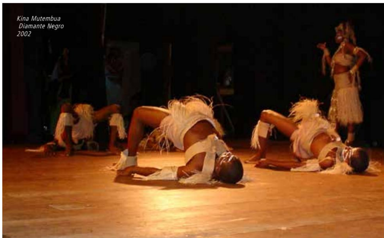
Kina Mutembua Diamante Negro 2002

O Grupo, hoje, passa por uma reestruturação e tem enfrentado desafios semelhantes àqueles apontados com relação ao Núcleo de Moda & Estilo. Ainda assim, é possível perceber o amadurecimento dos seus integrantes e o aumento da capacidade de aproveitar as oportunidades conquistadas.