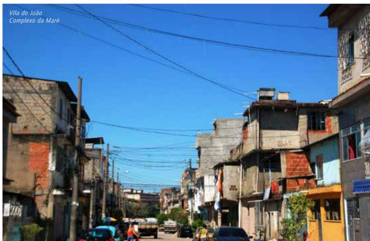
Vila do João Complexo da Maré

Na realidade, desde que as favelas surgiram na paisagem da cidade do Rio de Janeiro, pode-se observar um duplo movimento de percepção acerca desses espaços. O primeiro, diz respeito ao seu desenvolvimento histórico enquanto fato urbano. Nesse caso, estamos tratando de uma concepção que envolve uma complexidade de fatores e vieses. Quando se fala do desenvolvimento histórico desses espaços, necessariamente deve-se atentar para a sua relação com seu entorno imediato e com a cidade como um