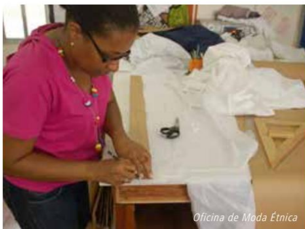
Oficina de Moda Étnica

Desse modo, essa categoria se refere a diferentes e diversos sujeitos sociais, remetendo a um corpo heterogêneo inserido em um contexto de luta por visibilidade social, aceitação pública e busca pela cidadania plena. Assim, esse conjunto abarca diferentes formas de solidariedade em paralelo a idéias como desenvolvimento individual, coesão comunitária e responsabilidade social. Ou seja, partindo dessa perspectiva, podemos considerar diversos setores da sociedade atuando como sujeitos ativos na reivindicação por melhorias de suas condições sociais, chegando a agir, inclusive, como propositores e executores de propostas que atinjam essa finalidade.