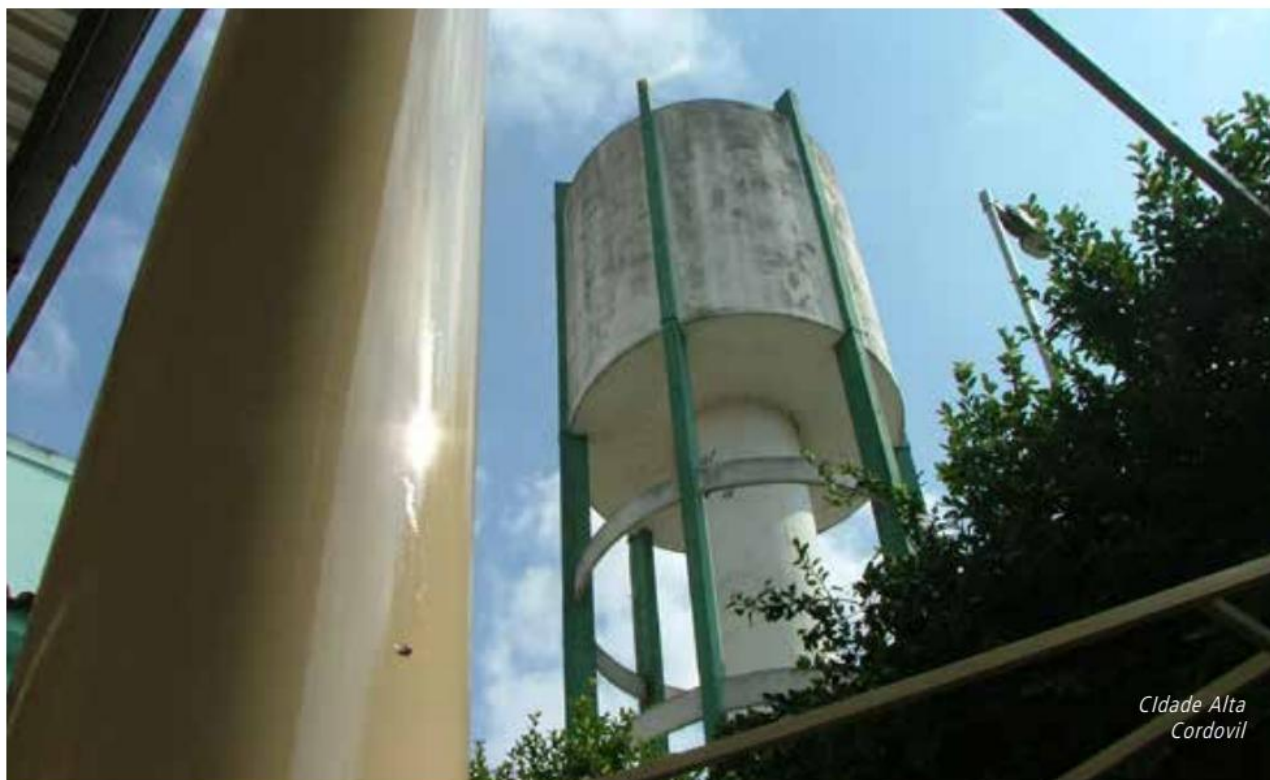
Cidade Alta Cordovil

todo. Assim, entramos em um campo amplo que engloba questões relacionadas a bens de infraestrutura urbana 19 , regularização de posse do terreno, equipamentos culturais e educacionais. Também nos referimos a postos de trabalho e condições para o estabelecimento de laços de solidariedade, além da participação dos meios de tomada de decisões que influenciam diretamente os rumos da cidade.