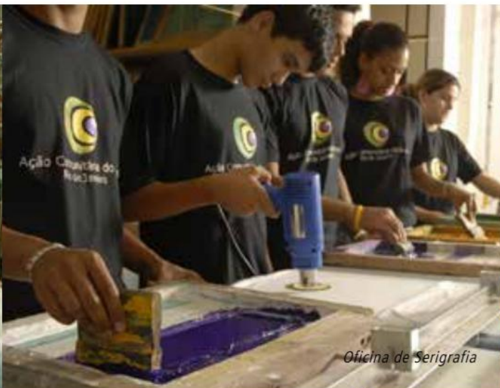
Oficina de Serigrafia