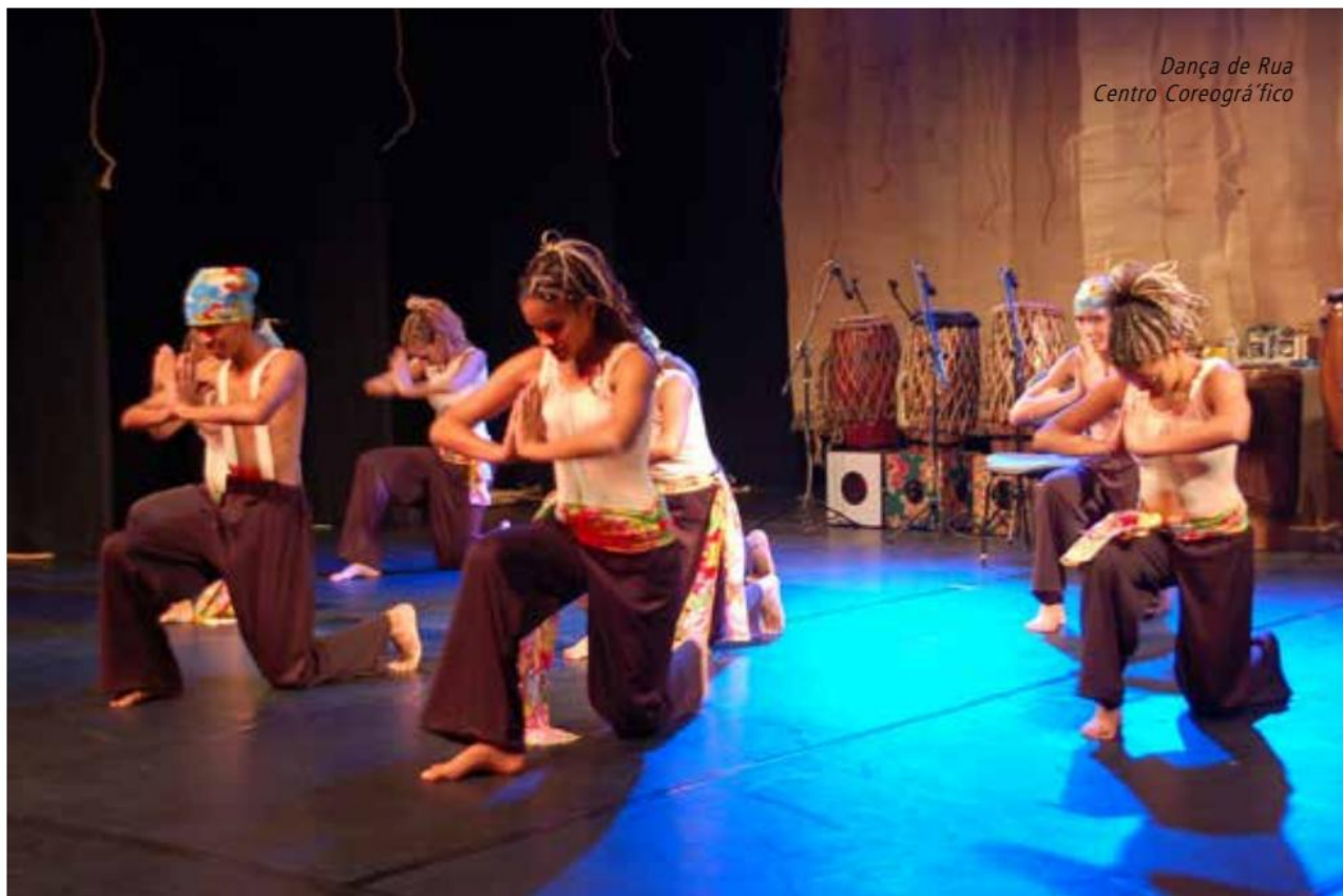
Dança de Rua Centro Coreográfico