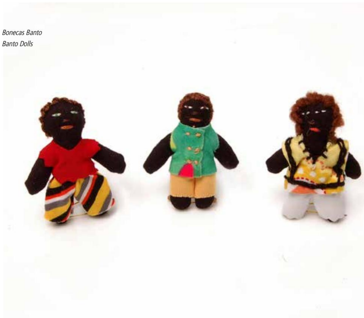
Bonecas Banto Banto Dolls

Nevertheless, it is necessary to examine the different types of performance of the different social subjects that form the civil society. In the early 90s, the Non-Governmental-Organizations began to obtain more visibility in our national scenario. Following the North American model in many cases, they act as a link between the local issues and the international cooperation, especially through the organizations' financing. However, it must be clear stated that the NGO's are only one more element of the nonprofit sector, which is a wide field formed by different profile institutions which present different performances that must be understood in their relation with the State structure and not as surrogates 30 .