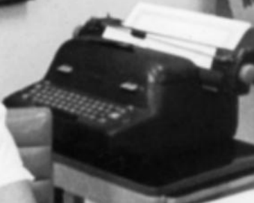
Ação Comunitária do Brasil Inserção no mercado de Trabalho - anos 70