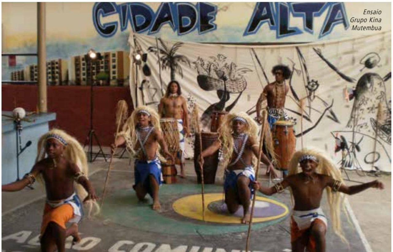
Ensaio Grupo Kina Mutembua