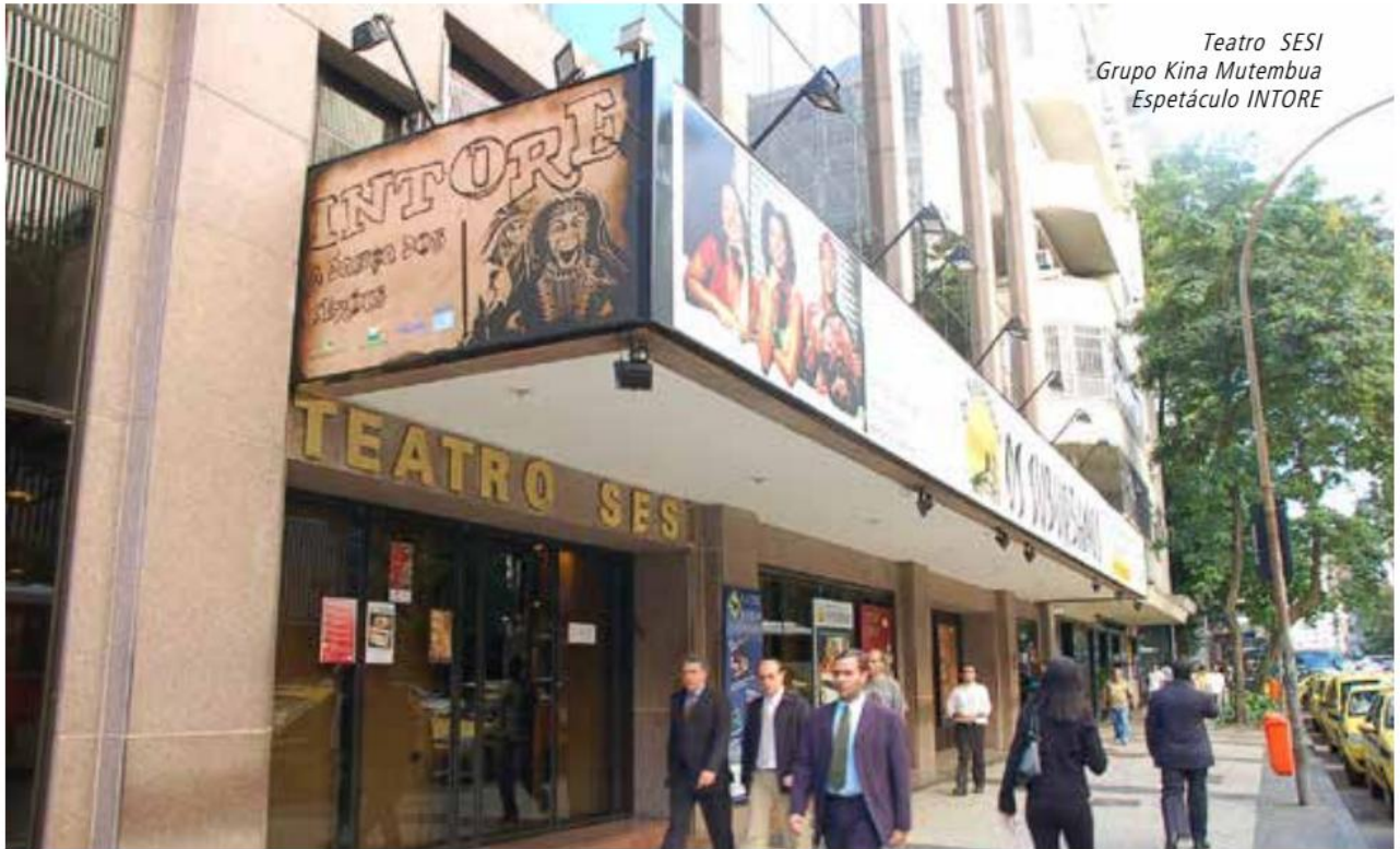
Teatro SESI Grupo Kina Mutembua Espetáculo INTORE