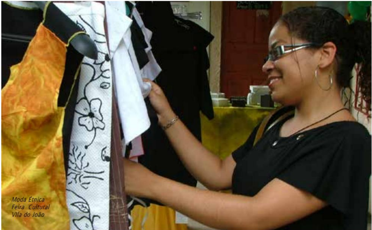
Moda Étnica Feira Cultural Vila do João