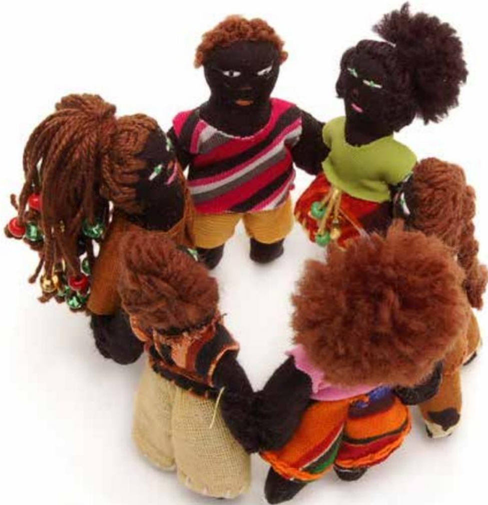
Bonecas Banto Banto Dolls

One of the ways to increase the learning and producing situations in the Project's workshops, besides providing it with visibility, was the creation of the Social Window space at the ACB/RJ headquarters in 2006. The Window was an integrated space including bookstore, cyber café, afro-hair services, and played a relevant role in exhibiting and creating conditions to commercialize the goods and services produced within the scope of the Project, under a social brand.