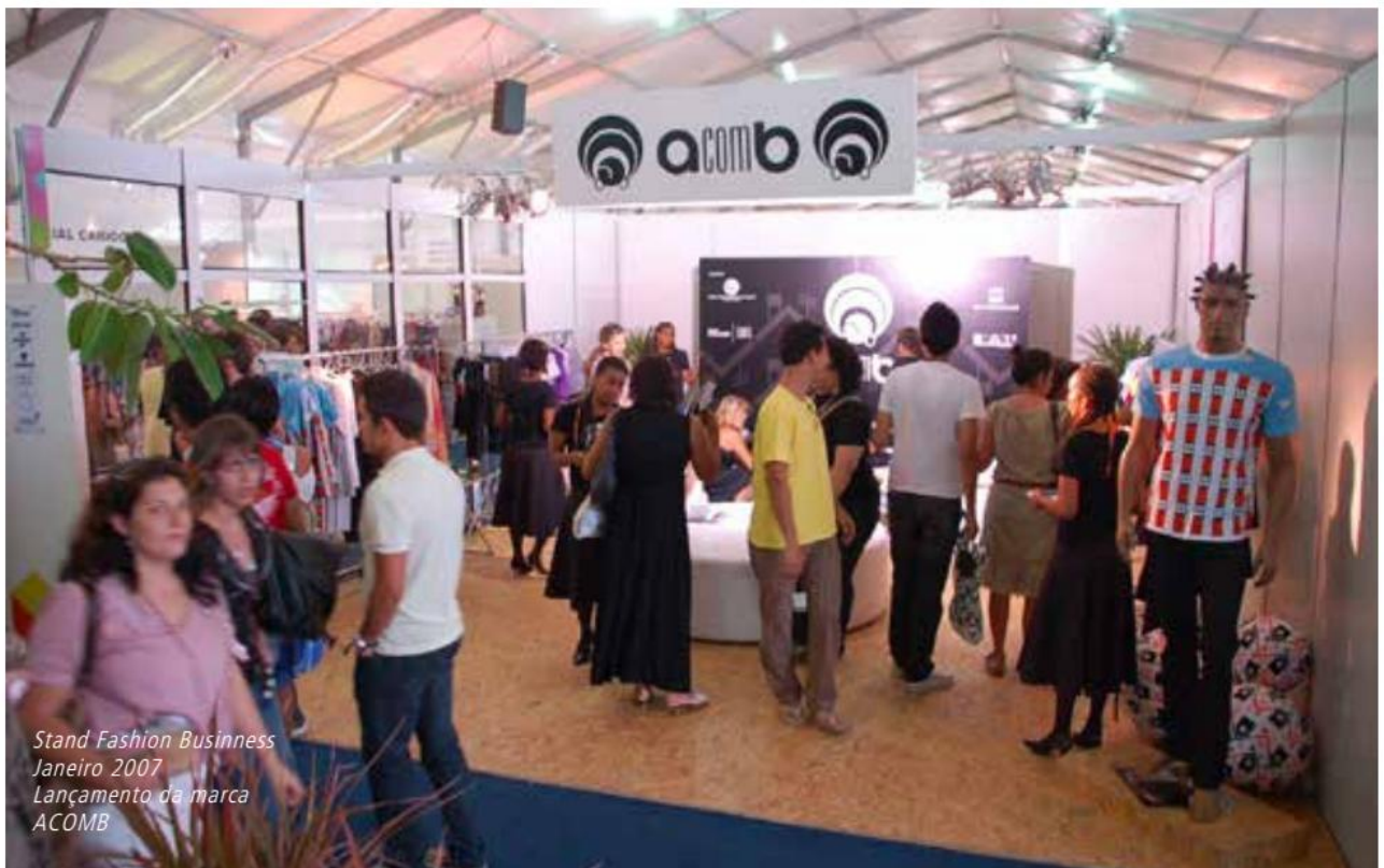
Stand Fashion Business Janeiro 2007 Lançamento da marca ACOMB