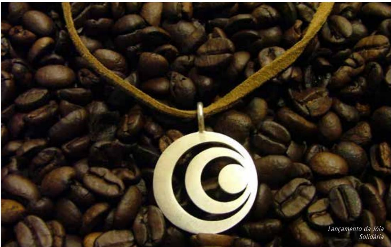
Lançamento da Jóia Solidária

Não devemos, igualmente, ignorar a necessidade de um debate amplo da sociedade sobre a exclusão provocada pela percepção social que a mesma constroi sobre as favelas. Ao negar a complexidade desses espaços, apenas se cria um outro agente de exclusão, limitador do acesso a direitos básicos e bens sociais, culturais e econômicos. Não se trata, assim, de negar certas mazelas, mas, sim, de se ter uma postura de assumi-las como um problema que também nos compete e, por isso, sua solução deve ser buscada por todos.