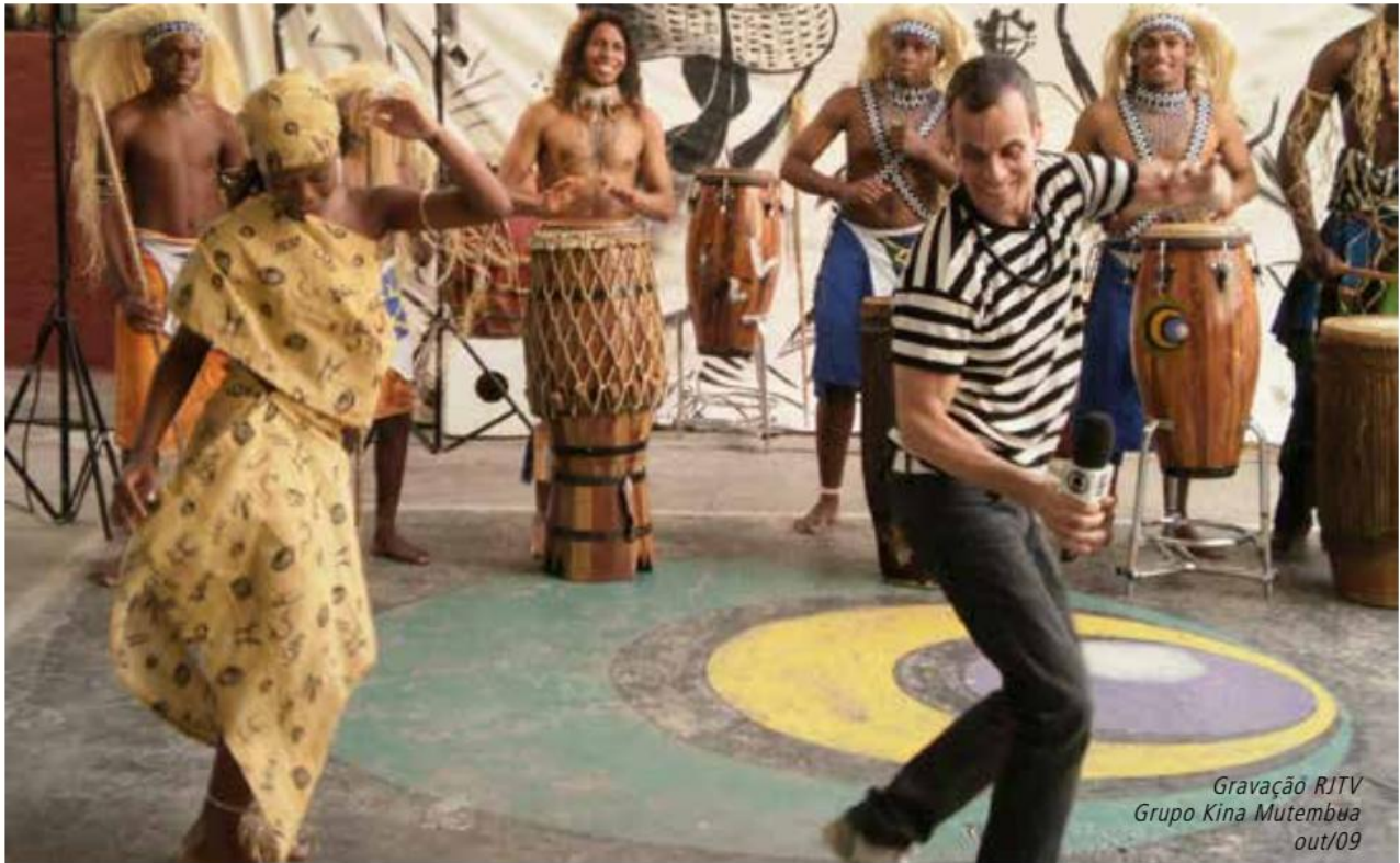
Gravação RJTV Grupo Kina Mutembua out/09