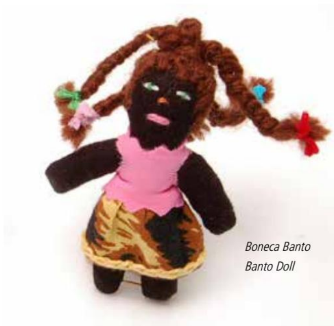
Boneca Banto Banto Doll

The successful enterprise created hope and expectations within Cidade Alta's community, and this fact produced a waiting line of women interested in joining this qualification segment, hoping to achieve their professional and financial independence. This nurtures a virtuous cycle started in the process, in which concrete opportunities of income generation combined with self-esteem enhancement are offered.