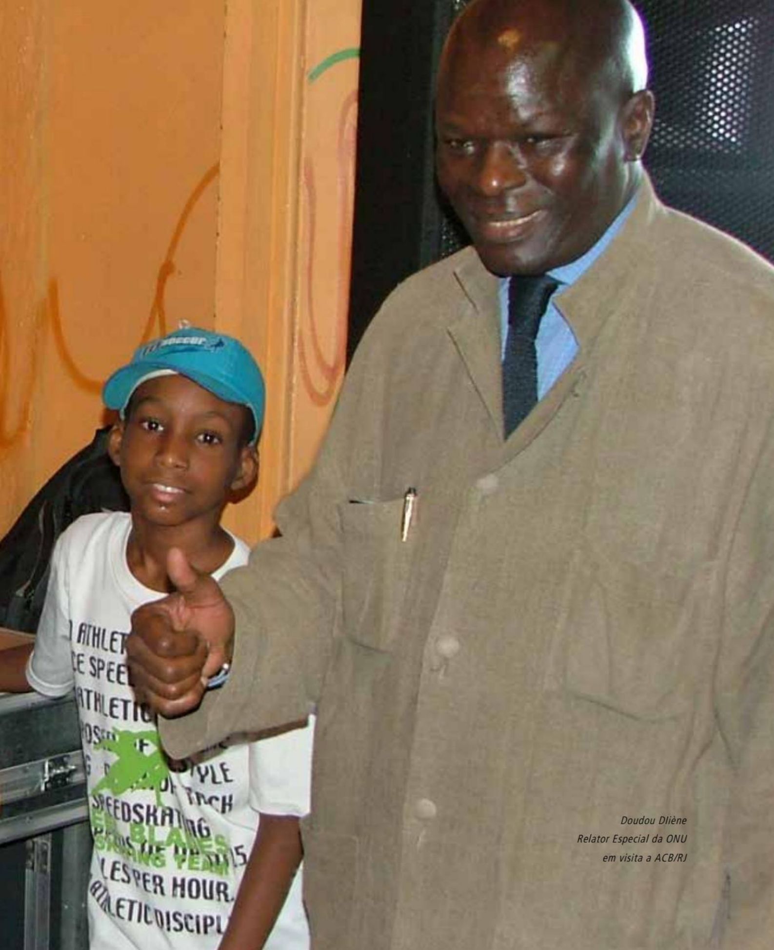
Doudou Diène Relator Especial da ONU em visita a ACB/RJ