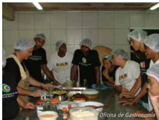
Oficina de Gastronomia