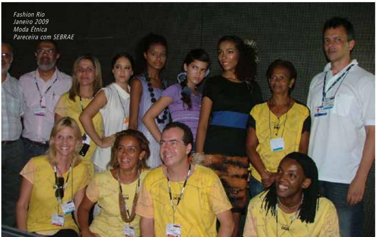
Fashion Rio Janeiro 2009 Moda Étnica Pareceira com SEBRAE