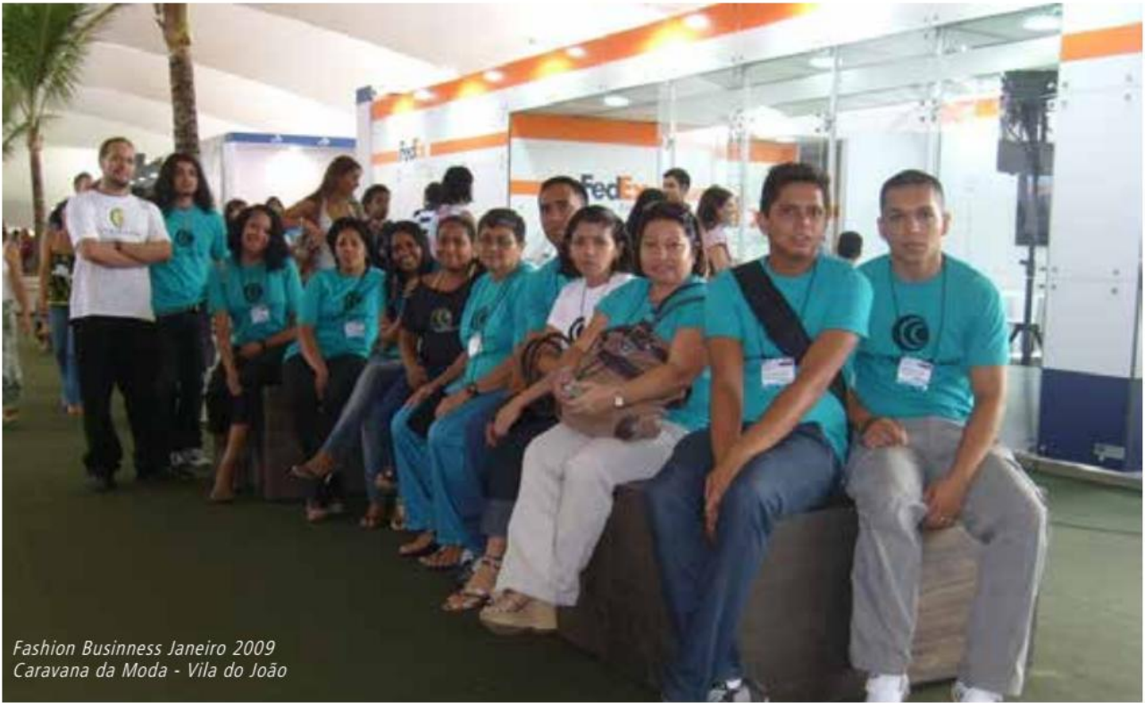
Fashion Business Janeiro 2009 Caravana da Moda - Vila do João